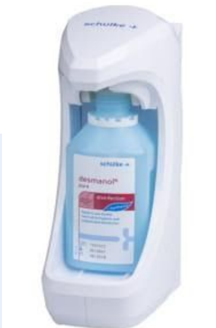
Dozownik automatyczny RX 5 T

Dozownik bezdotykowy RX 5 T do butelek 500 ml